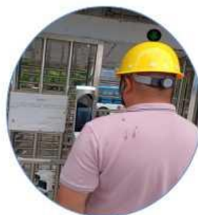
人脸识别考勤打卡