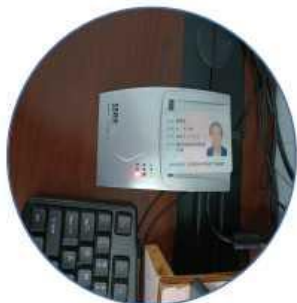
工人身份信息采集