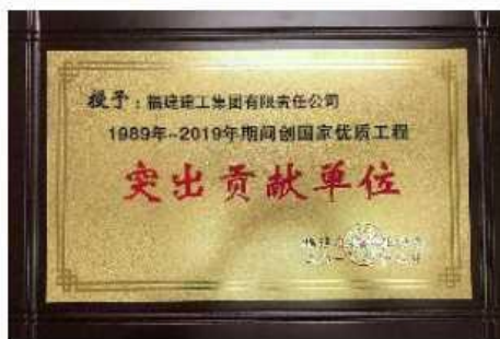
创国优突出贡献单位