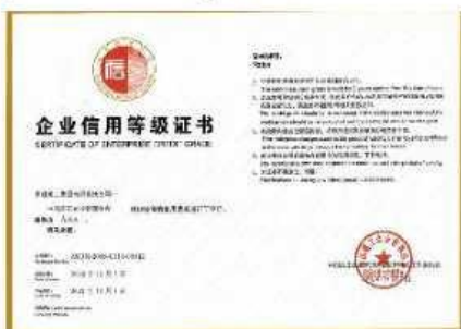
中国施工企业管理协会 AAA